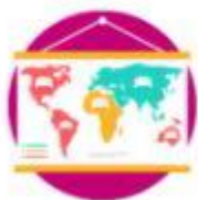
Economic impact - Air carriers