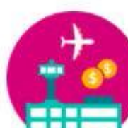
ECONOMIC IMPACT - AIRPORTS