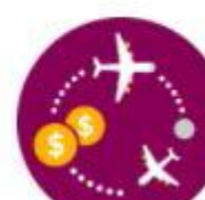
ECONOMIC IMPACT - ANSPS